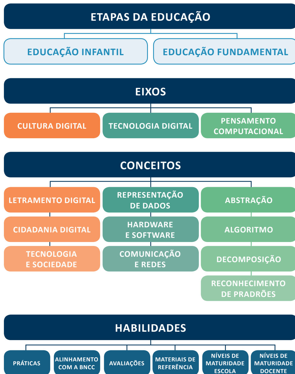
Figura 1: Estrutura do Currículo de Referência em Tecnologia e Computação

Esta proposta de organização do Currículo de Referência em Tecnologia e Computação pode ser vista na Figura 1.